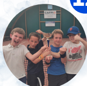
Équipe 8-10 ans Tennis Club Castelbriantais