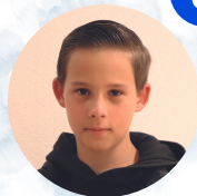
Ludigy BOUTET Boxing Club Castelbriantais