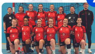
Équipe Seniors féminines ALC Handball