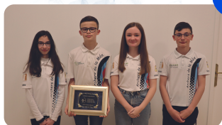
Équipe Jeunes Archers de la Mée