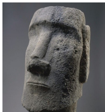
Tête Moai de l'île de Paques

Un parcours pour percevoir les différentes manières de représenter la nature et comprendre sa place dans les œuvres d'art.