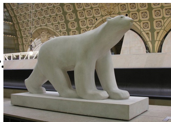
POMPON François, L'Ours Blanc,